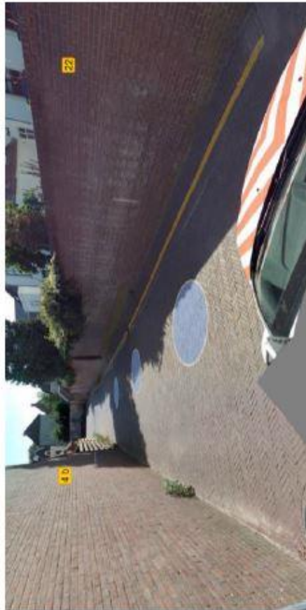
Locatieafbeelding verkeersbesluit instellen gele streep Hoo gestraat