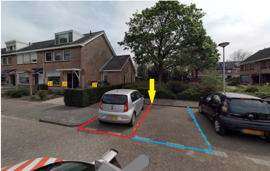
Afbeelding 1. Locatie parkeergelegenheid voor het opladen van elektrische voertuigen aan de De Raadtweg.

(Rode markering= Besluit punt 1: Nu te realiseren parkeervak voor opladen elektrische voertuigen.