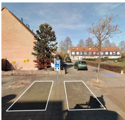
Figuur 2 afbeelding van het straatbeeld met de beoogde positie van de laadpaal