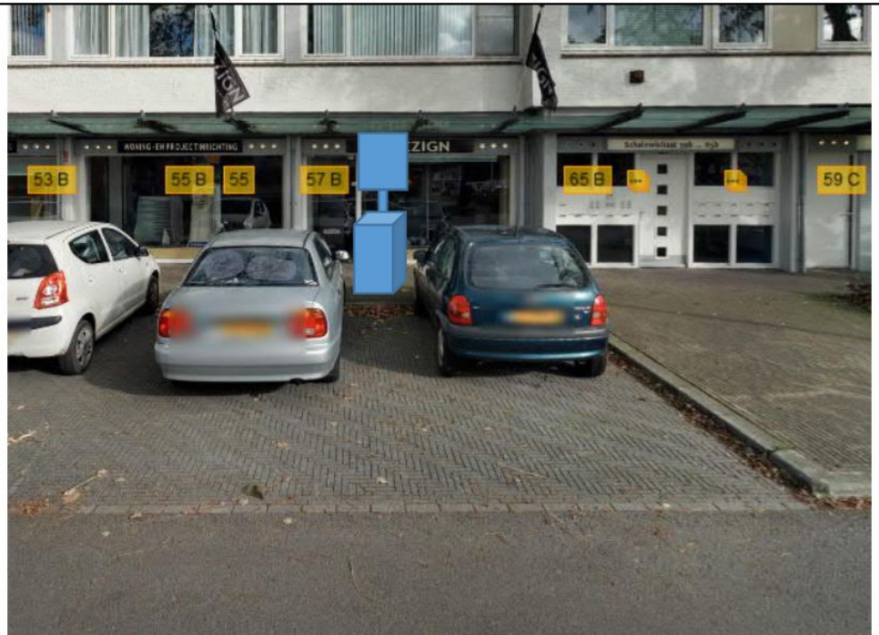
Foto 2 locatie voorstel