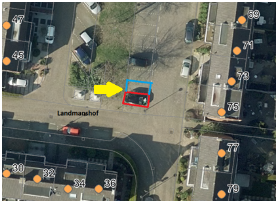
Afbeelding 2. Luchtfoto met locatie parkeergelegenheid voor het opladen van elektrische voertuigen aan de Landmanshof. (Rode markering = Besluit punt 1: Nu te realiseren parkeervak voor opladen elektrische voertuigen. Blauwe markering= Besluit punt 2: In de toekomst te realiseren extra parkeervak voor opladen elektrische voertuigen.) Geel=aanwezen locatie voor oplaadpaal en bord E4)