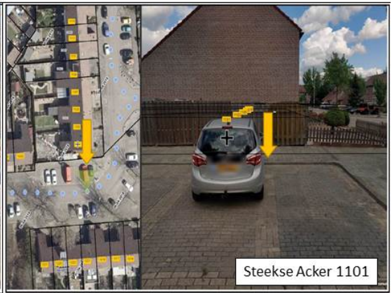
Steekse Acker 1101