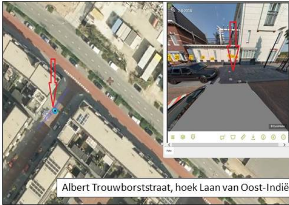
Albert Trouwborststraat, hoek Laan van Oost-Indië