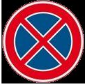
E2 Verbod stil te staan