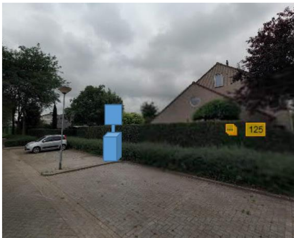
Oisterwijk, 23 augustus 2019