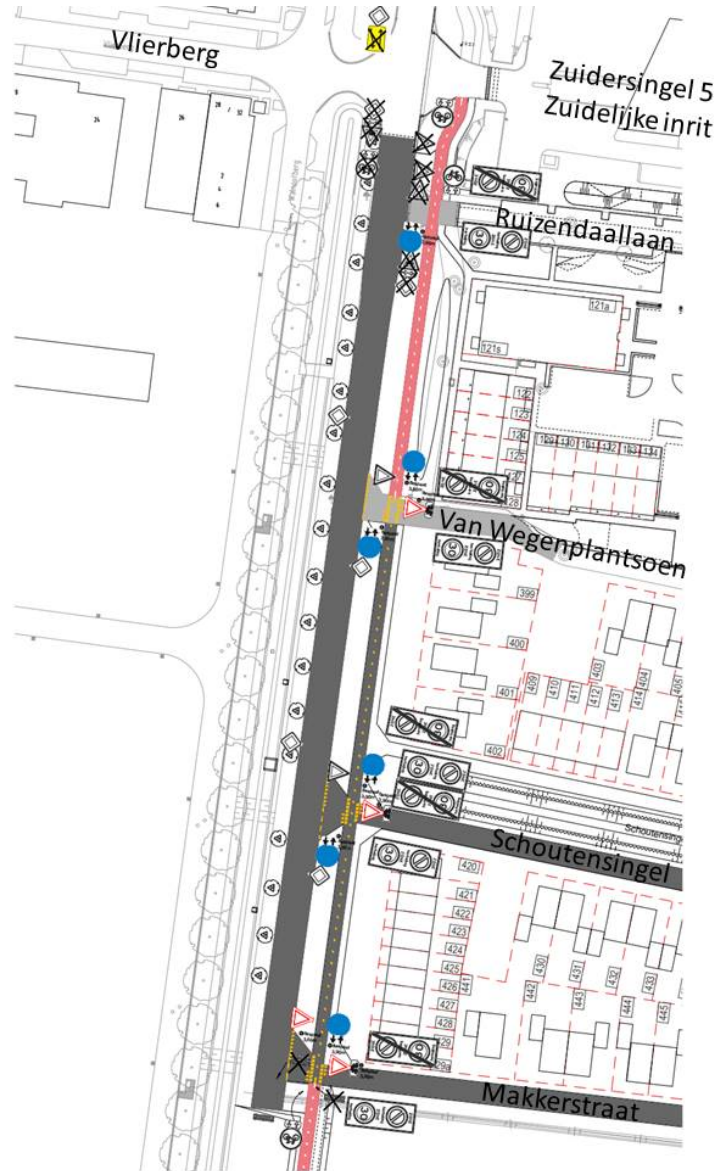
Situatietekening voormalige situatie met fietspad op rijbaan Zuidersingel (westzijde)