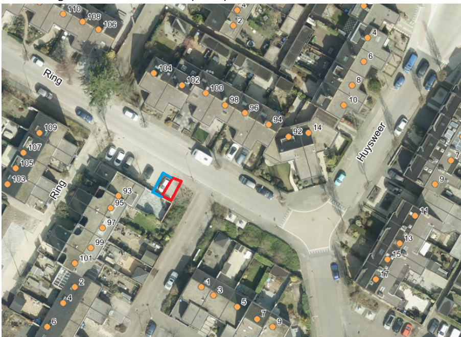
Afbeelding 2. Luchtfoto met de in te trekken locatie parkeergelegenheid voor het opladen van elektrische voertuigen aan de Ring.

Geel=aangewezen locatie voor oplaadpaal en bord E4)