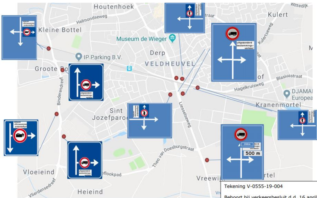
Tekening V-0555-19-004 Behoort bij verkeersbesluit d.d. 16 april 2019 Verbod voor doorgaand vrachtverkeer zaak 00658417