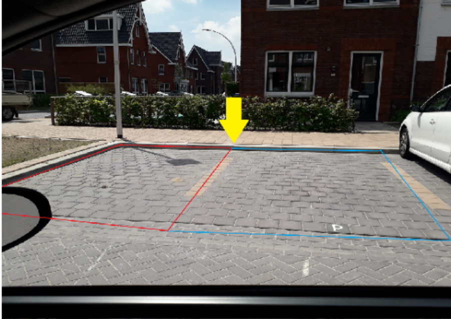
Afbeelding 1. Locatie parkeergelegenheid voor het opladen van elektrische voertuigen aan de Perzikengarde.

(Rode markering= Besluit punt 1: Nu te realiseren parkeervak voor opladen elektrische voertuigen. Blauwe markering= Besluit punt 2: In de toekomst te realiseren extra parkeervak voor opladen elektrische voertuigen. Geel=aangewezen locatie voor oplaadpaal en bord E4)