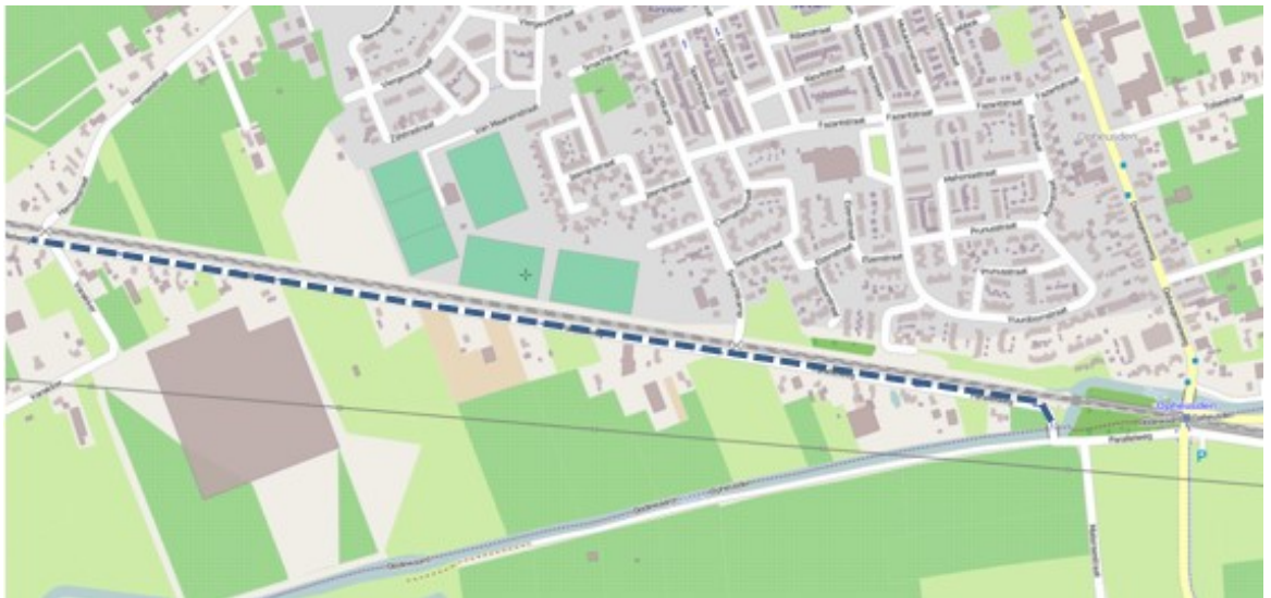
Afbeelding 3: parkeerverbod Parallelweg Opheusden