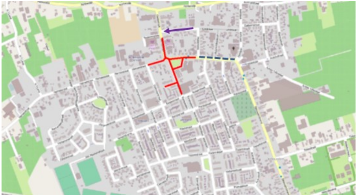
Afbeelding 1: In rood: af te sluiten wegdelen. In blauw: wegen met beperkte toegang. In paars: eenrichtingsverkeer Lindenlaan.

In verband met dit evenement worden diverse wegen rond het gemeentehuis (gedeeltelijk) afgesloten (zie afbeelding 1). Vanwege deze afsluiting wordt een omleiding ingesteld voor lokaal verkeer, vergelijkbaar met de omleiding die wordt ingesteld tijdens de jaarmarkt (zie afbeelding 2). Vrachtverkeer wordt hierbij vanaf de snelweg omgeleid via aansluiting 35 (Ochten). Langs de omleidingsroute worden ook parkeerverboden ingesteld om de doorstroming te verbeteren (zie afbeelding 2). Verkeersregelaars worden ingezet om het verkeer in goede banen te leiden en te informeren over de beschikbare routes. Naast bovengenoemde parkeerverboden wordt parkeren ook verboden in delen van de Dalwagenseweg en de Parallelweg (zie afbeeldingen 2 en 3) om de bereikbaarheid van Opheusden te garanderen. In de Lindenlaan wordt daarom tevens eenrichtingsverkeer ingesteld vanaf de Middenweg richting Dorpsstraat (zie afbeelding 1).