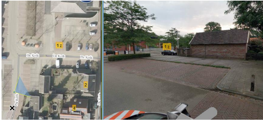
Bentele, Burg. Buyvoetsplein 76 (SC29744)