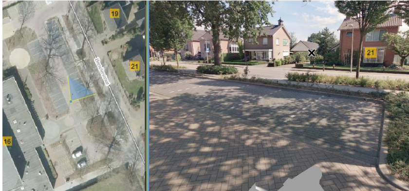
Markelo, Taets van Amerongenstraat 15 (SC29741)