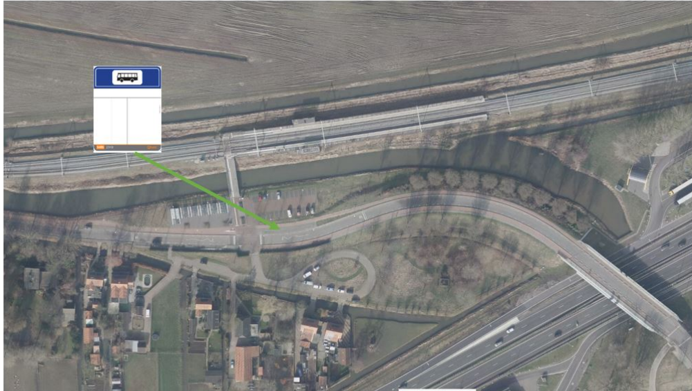
Afbeelding 3 : Het toevoegen van halte