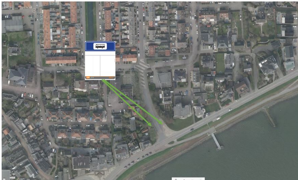
Afbeelding 2 : Het wijzigen van haltes