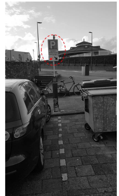
Bijlage 1: Situatietekening