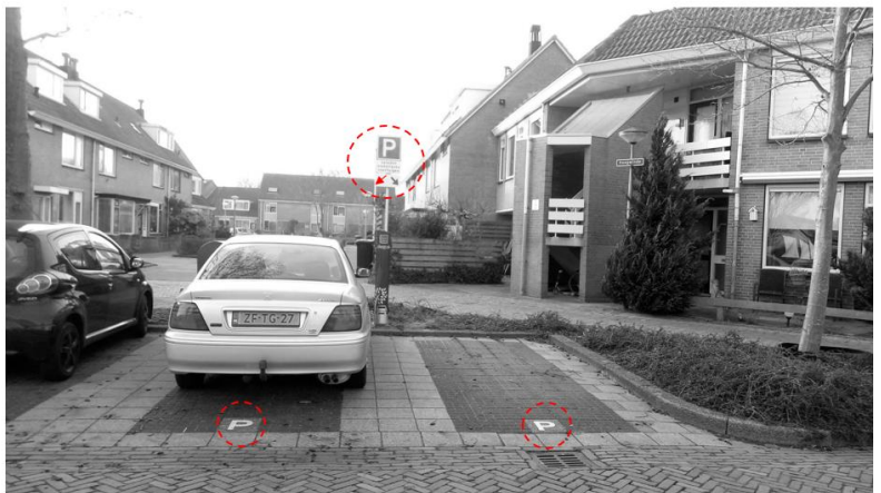
Bijlage 1: Situatietekening