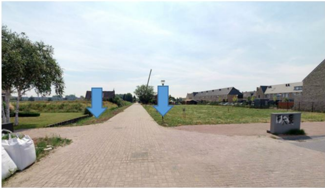
Figuur 4: Locatie C Tuinbouwweg