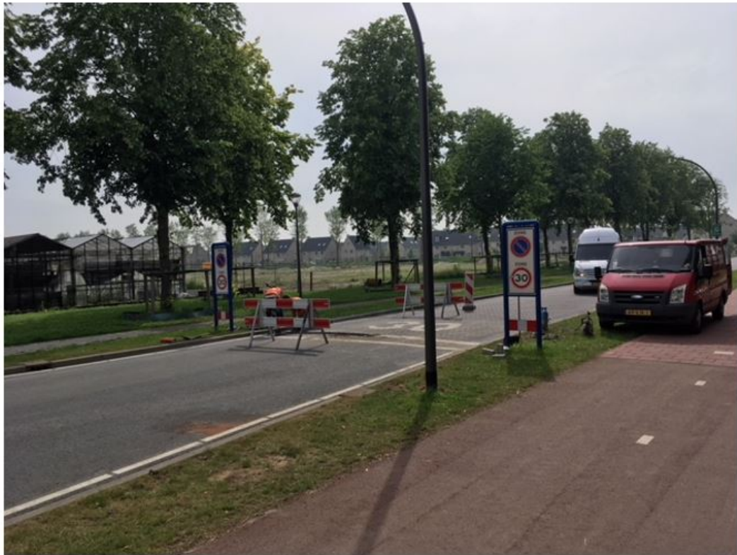
Figuur 2: Locatie A Parklaan