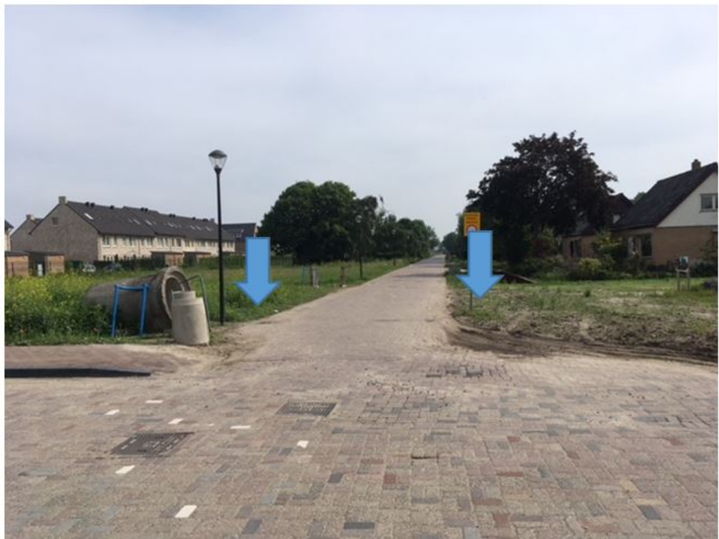
Figuur 5: Locatie D Tuinbouwweg