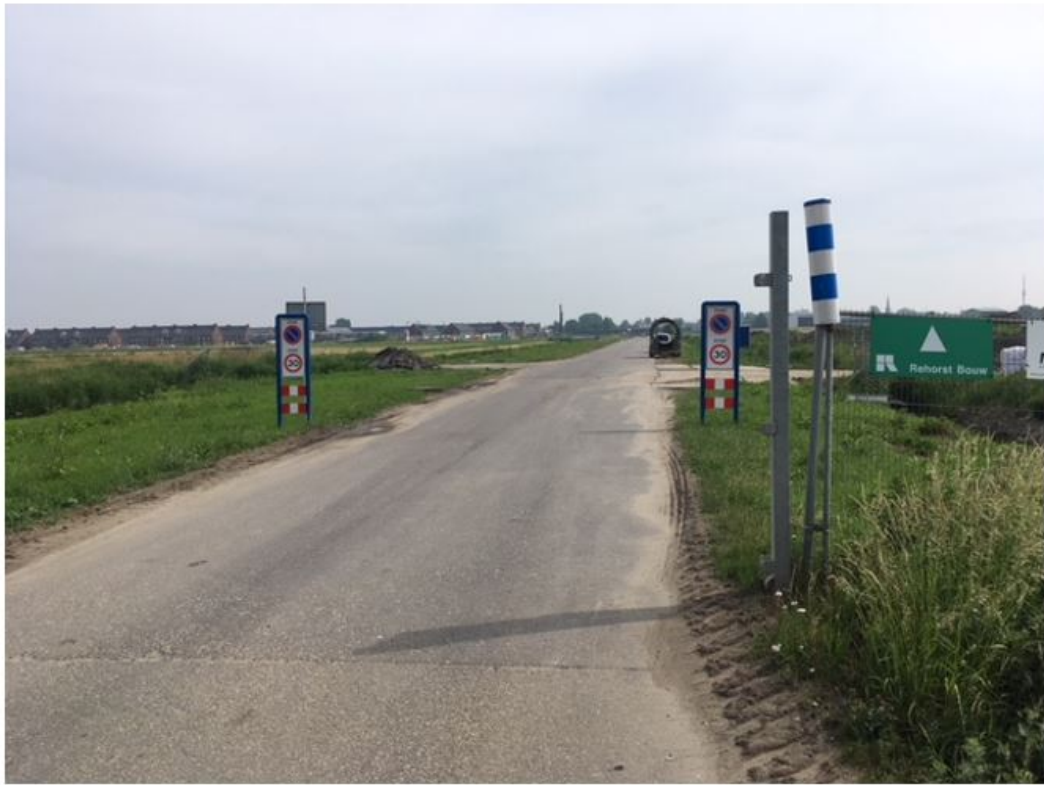
Figuur 6: Locatie E Nader te benoemen weg