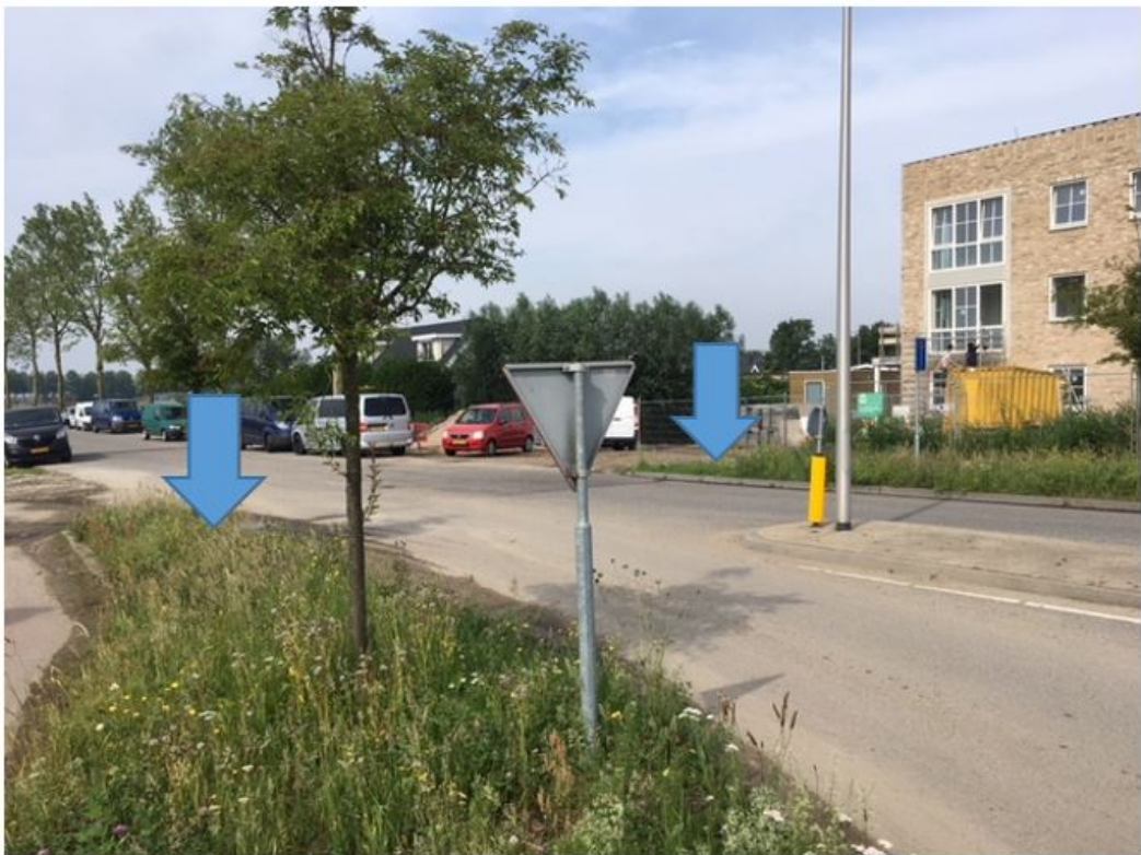
Figuur 3: Locatie B Polderbaan