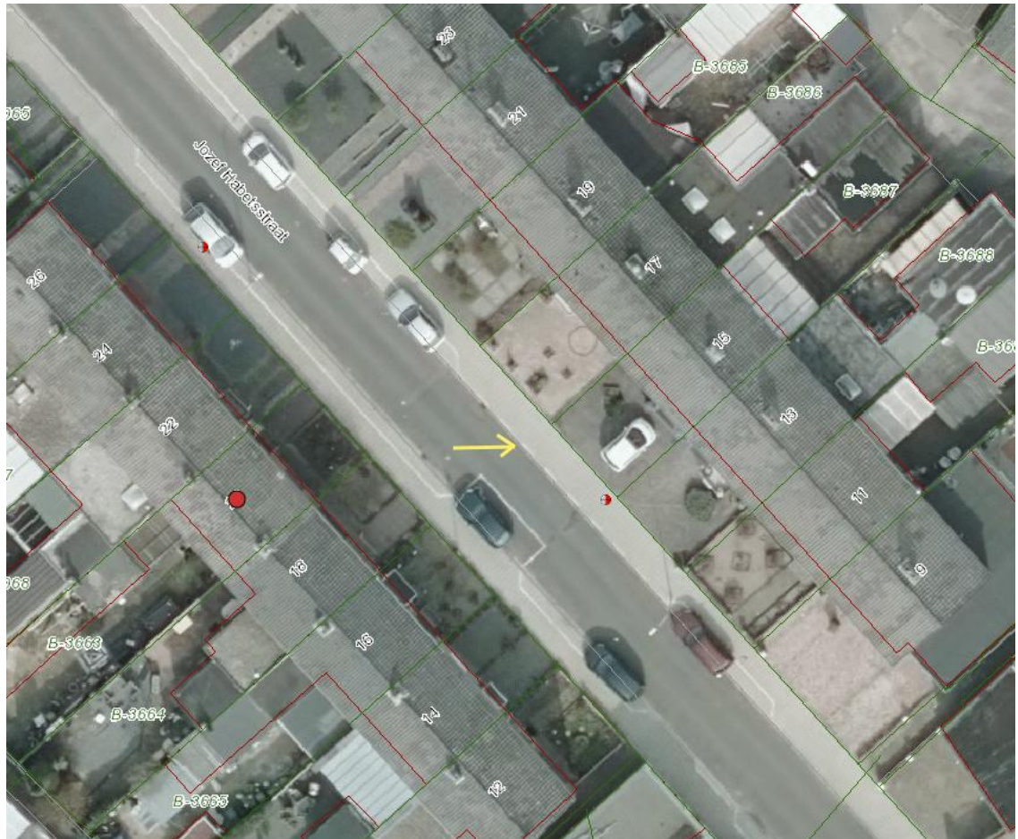
Locatie parkeerverbod Jozef Habetsstraat

Indien onverwijld spoed, gelet op de betrokken belangen, dat vereist, kan –nadat bezwaar is gemaakt bij het College van Burgemeester en Wethouders- aan de voorzieningenrechter van de rechtbank Limburg (bestuursrecht): Postbus 950; 6040 AZ ROERMOND, worden verzocht om een voorlopige voorziening te treffen. Hieraan zijn griffierechten verbonden.