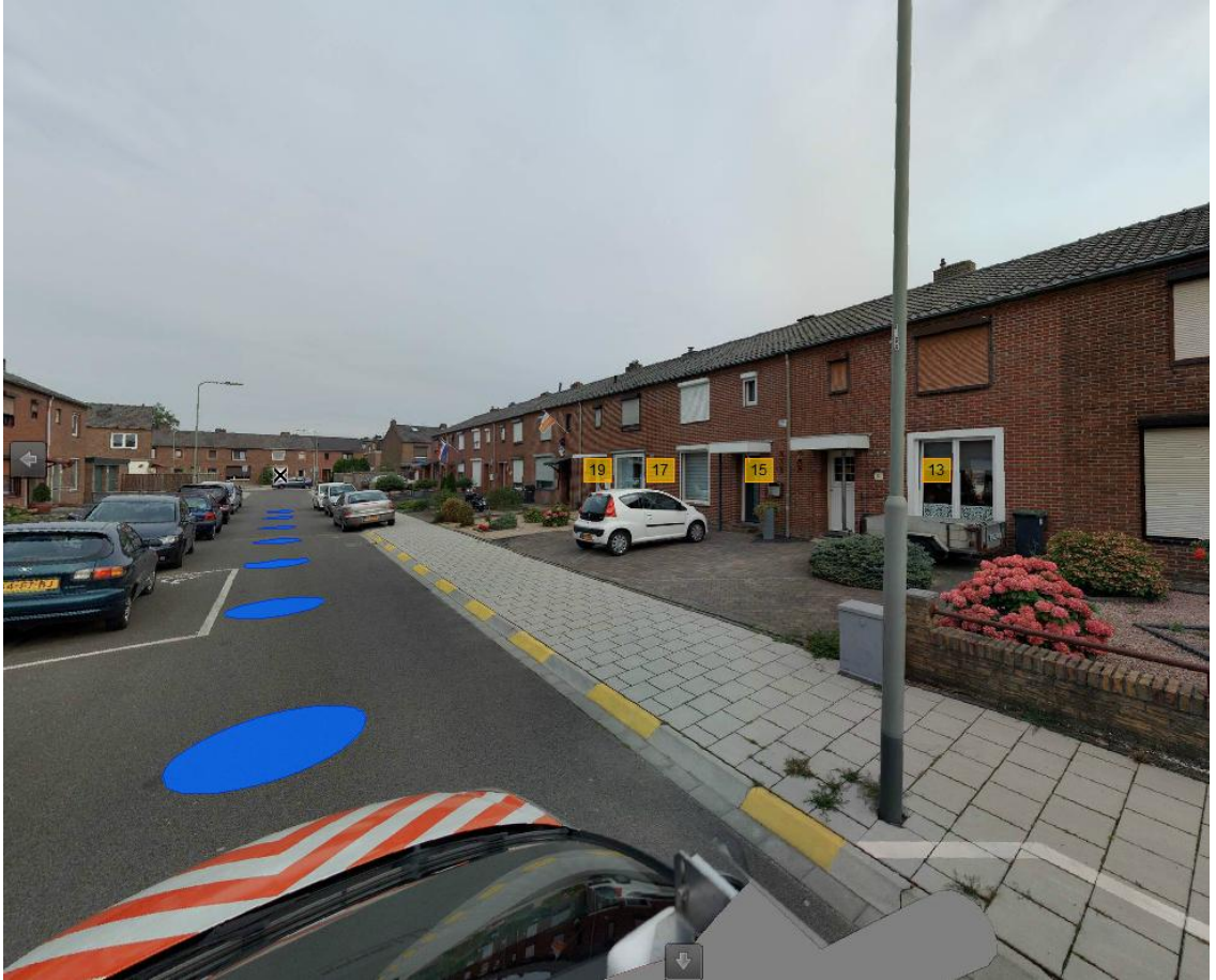
Te verwijderen gele onderbroken markering (parkeerverbod)