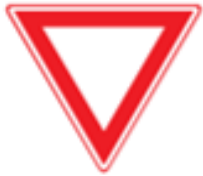
B6: Verleen voorrang aan bestuurders op de kruisende weg,

De markering in de vorm van haaiantanden die de voorrangssituatie ondersteunen wordt op de betreffende locatie aangebracht. Daarnaast zal op meerdere locaties van de Buitenbrinkweg de aanduiding "60" met markering op het wegdek worden aangebracht.