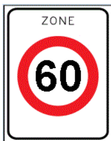
A1: 60 km/h (zone)

Plaatsing van de volgende verkeerstekens: