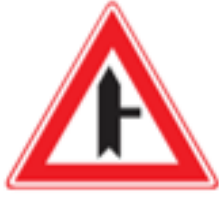
B5: Voorrangskruispunt zijweg rechts