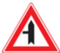
B4: Voorrangskruispunt zijweg links

Ten behoeve van uniformiteit wordt op de kruising Buitenbrinkweg- Horster Zoomweg een voorrangregeling aangebracht met de volgende verkeerstekens: