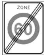
A2: einde 60 km/h (zone)

Ten behoeve van uniformiteit wordt op de kruising Buitenbrinkweg- Horster Zoomweg een voorrangregeling aangebracht met de volgende verkeerstekens: