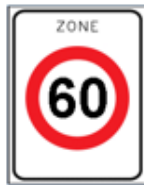
A1: 60 km/h (zone)

Plaatsing van de volgende verkeerstekens: