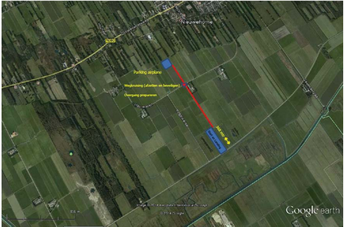
Veld baan Flaeijl Friesland