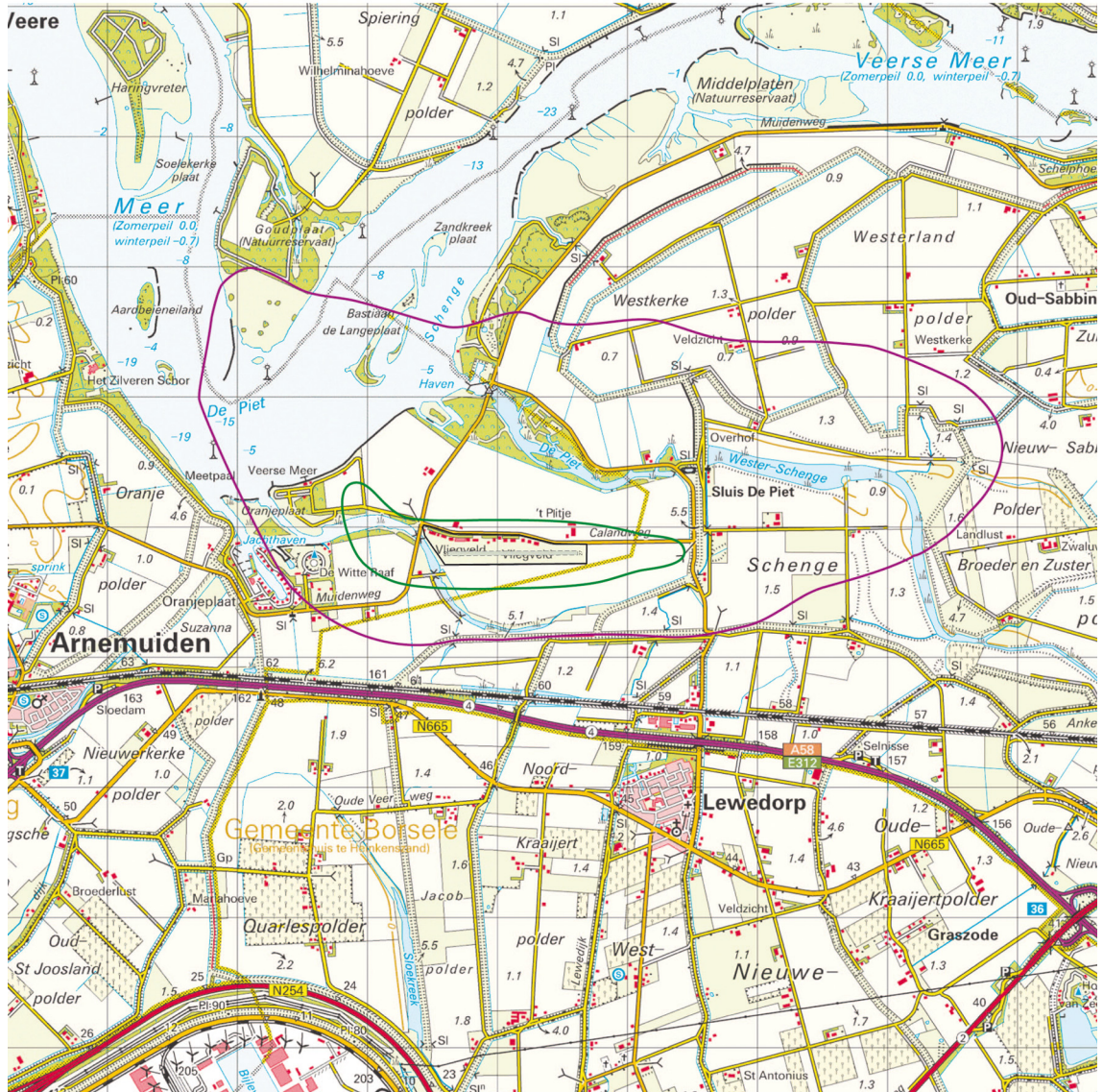
Bkl-geluidscontouren NLR berekeningsnummer 020905-160000