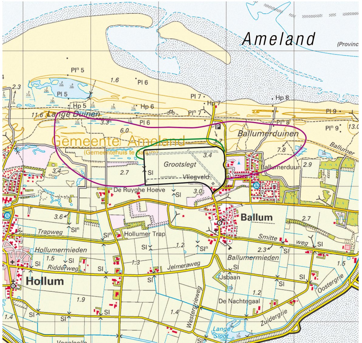
Kaart met de geluidszone (tek.nr. 99-12345N-999) NLR berekeningsnummer 020412-172213