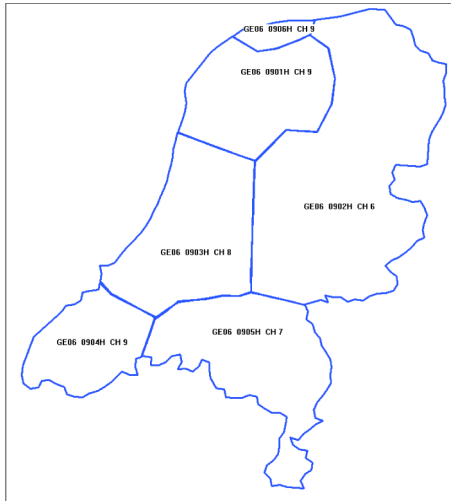
Figuur 2. Geografische indeling van de frequentieruimte

De DVBT allotments K6, K7, K8, K9 kunnen respectievelijk opgesplitst worden in de TDAB blokken A,B,C,D. De oorspronkelijke allotmentvorm is hierdoor niet aangetast.