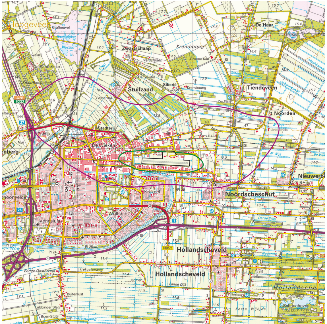
Kaart met de Bkl-geluidszone en de daarbij behorende contouren