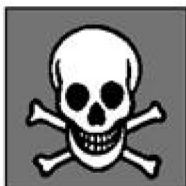
doodshoofd met gekruste doodsbeenderen

Bijgevoegde illustratie geeft een beeld van de gevaarsymbolen.