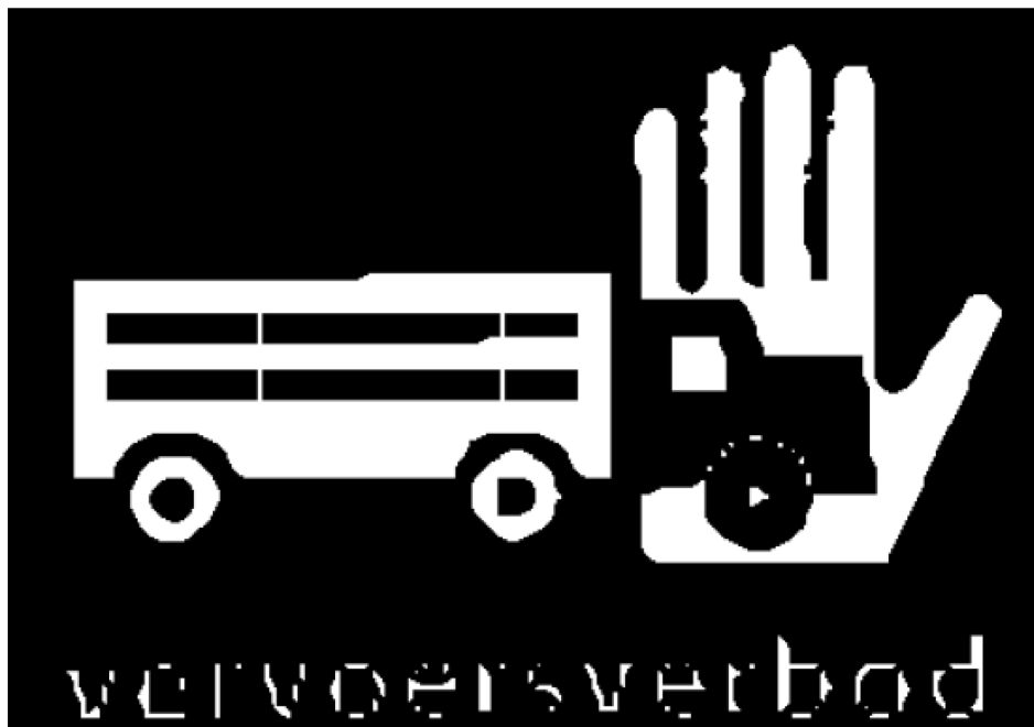
Bijlage 22. Modellen van kentekenen als bedoeld in artikel 103

a. Blauw van kleur en bedrukt met zwarte letters: