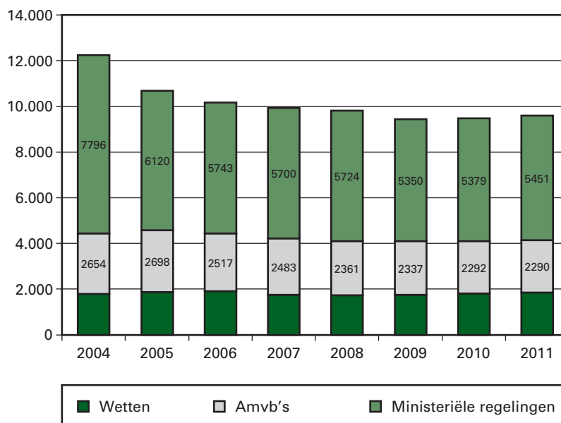
Figuur: Aantal geldende wetten, AmvB's en ministeriële regelingen per 1 januari 2004–2011

Vanaf 2004 tot 2010 is het aantal geldende wetten, AMvB's en ministeriële regelingen gedaald, maar in 2011 was sprake van een lichte stijging van het aantal wetten, AMvB's en ministeriële regelingen ten opzichte van 2010. Belangrijke reden hiervoor is de extra regelgeving die nodig was voor het ingaan van de nieuwe staatkundige structuur van het Koninkrijk der Nederlanden per 10 oktober 2010.