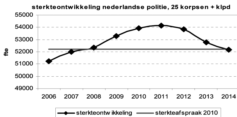
Figuur 2: