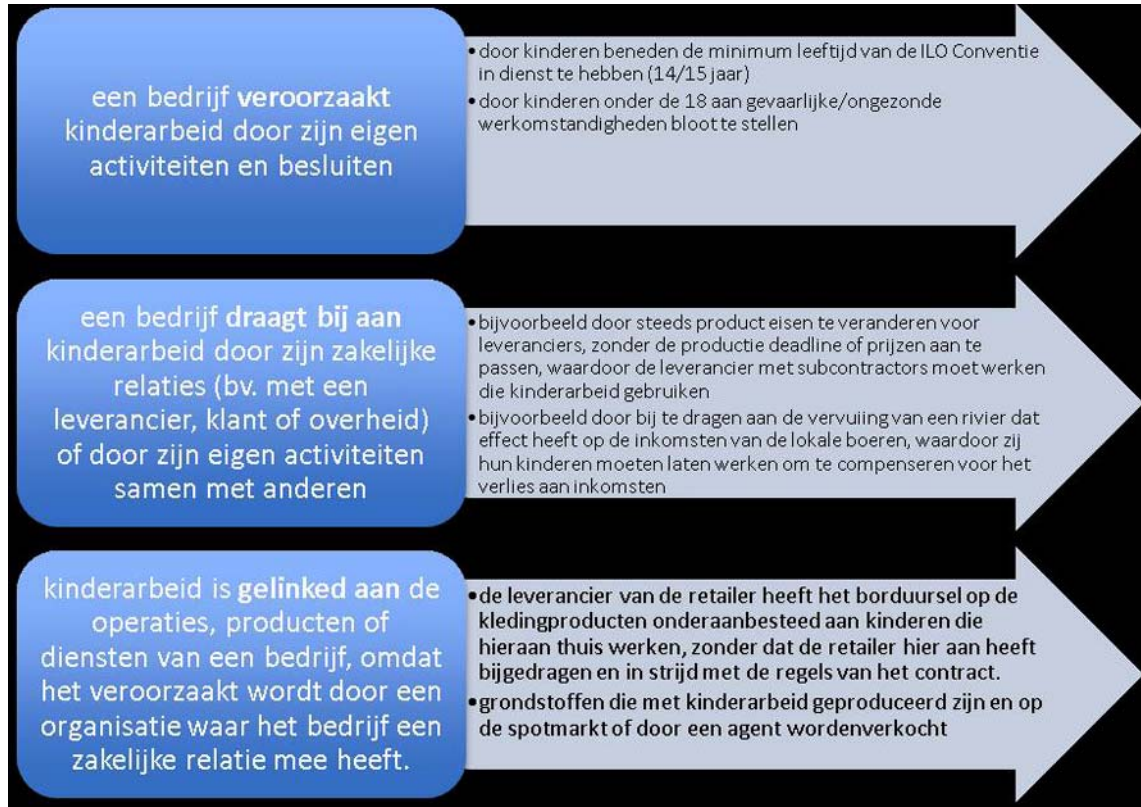
Figuur 1