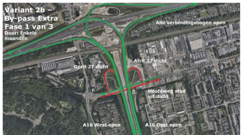
Figuur 8 – Variant 2b, fase 1

Variant 2b is gelijk aan variant 2a, maar de westelijke bypass (verkeer van noord naar zuid) heeft hier 4 in plaats van 2 rijstroken. De fasering is hetzelfde. De tijdsduur is gelijk aan variant 2a. Door de extra rijstroken aan de westzijde is de verkeershinder significant minder en voor het Hoofdweggenet vergelijkbaar met de huidige situatie.