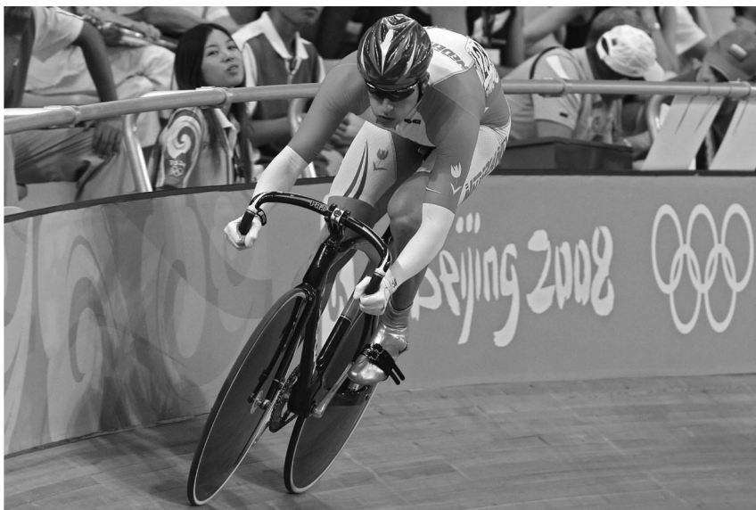
Meervoudig sprintkampioen Theo Bos in actie in Beijing.

productiekosten met zich meegebracht. Het is vanzelfsprekend dat de opgedane ervaringen later in het reguliere productieproces worden benut.