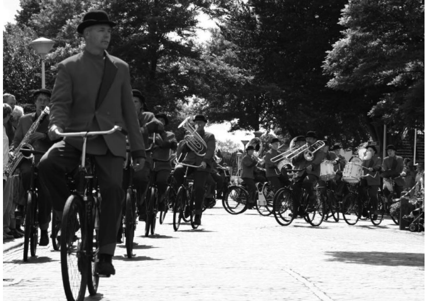
Het fietsende muzikpeloton van Crescendo uit Opende (Gr)