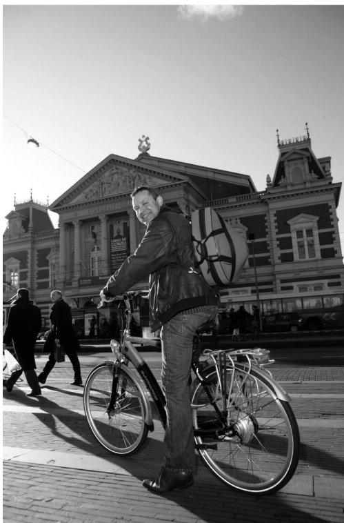
De elektrische fiets of E-bike.

Eén van de meest recente vernieuwingen binnen de fietsbranche is de introductie van de elektrische fiets. Deze E-bike is een fiets waarbij de kracht die de fietser op de pedalen zet, dankzij een elektrisch systeem wordt aangevuld. Daardoor wordt het fietsen gemakkelijker en wordt het mogelijk om zonder extra inspanning een grotere afstand te overbruggen.