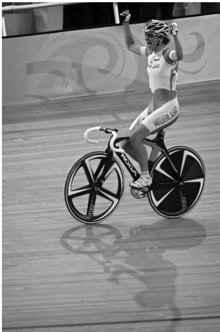
Marianne Vos wint Olympisch goud op de wielerveen in Beijing (2008). In 2010 worden in Apeldoorn de wereldkampioenschappen wielrennen op de baan georganiseerd.

Nederland is wereldwijd het belangrijkste fietsland. Prestaties in de wielersport ondersteunen dit beeld krachtig. Het positieve beeld kan verder worden versterkt door structureel in te zetten op de organisatie van grote en aansprekende fiets- en wielerevenementen.