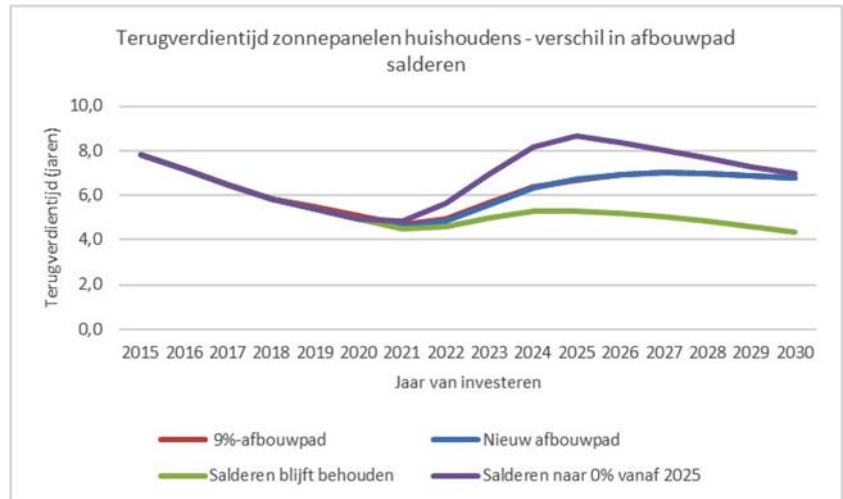
Figuur 1: Terugverdientijd voor het referentiesysteem bij verschillende afbouwpaden van salderen: -9% afbouwpad, nieuwe afbouwpad, een pad waarbij de huidige regeling blijft bestaan en een pad waarbij salderen in 2025 direct naar 0% wordt teruggebracht.