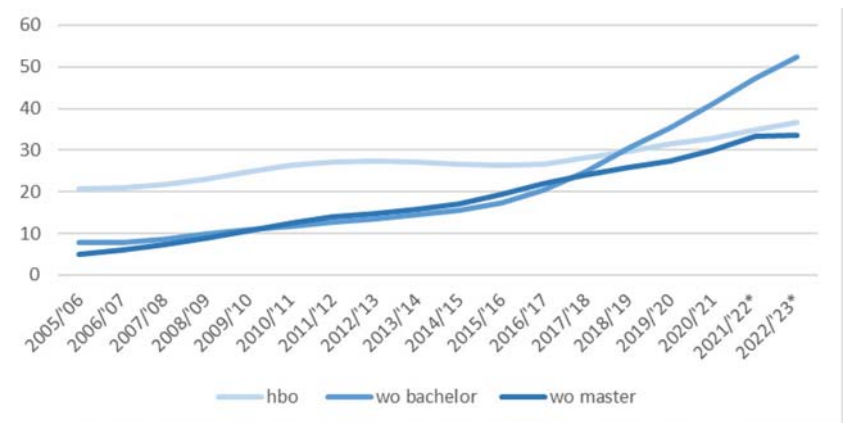
Figuur 1. Totale internationale studentenaantallen (x 1.000) 3

van daarbuiten (niet-EER-studenten). Het is een duidelijke trend dat steeds meer internationale studenten dankbaar gebruik maken van de mogelijkheid om hun studie, een deel van de studie of een stage binnen het Nederlandse hoger onderwijs te genieten.