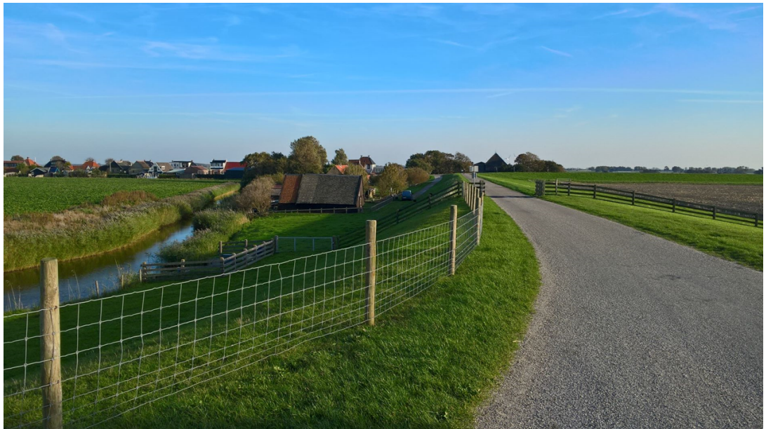
Oude dijk bij de Westhoek, onderdeel provinciale dijkstructuur