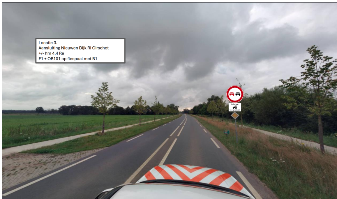
Locatie 3. Aansluiting Nieuwen Dijk Ri Oirschot +/- hm 4,4 Re F1 + OB101 op flespaal met B1