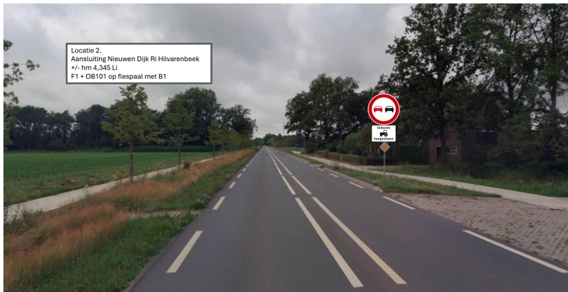
Locatie 2. Aansluiting Nieuwen Dijk Ri Hiltvarenbeek +/- hm 4,345 Li F1 + OB101 op flespaal met B1