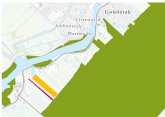
Figuur 1. Locatie compensatiegrond (oranje), ligging (voormalige) evz Torenvliet (paars).

Het Hoogheemraadschap van Schieland en de Krimpenerwaard (HHSK) wil de dijk tussen Krimpen aan de IJssel en Gouderak versterken. Deze dijkversterking wordt uitgevoerd in het project Krachtige IJsseldijken Krimpenerwaard (KIJK). Een onderdeel hiervan is het 'NNN compensatieplan dijkversterking KIJK', waarin is uitgewerkt dat er 1,98 ha NatuurNetwerk Nederland (NNN) gecompenseerd moet worden. Als locatie hiervoor zijn twee percelen van de provincie nabij Gouderak aangewezen (zie figuur).