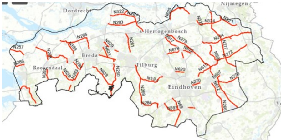
Figuur 2: Overzicht van de ligging van de Provinciale weg.

De resultaten van het onderzoek met betrekking tot de Provinciale weg van Noord-Brabant zijn samengevat in 5.3 Overzicht en beoordeling van het aantal bewoners