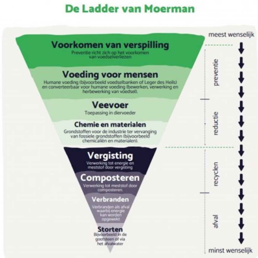
Figuur 2, Ladder van Moerman

De Ladder van Moerman is een model dat laat zien hoe voedsel/grondstoffen zo hoogwaardig mogelijk gebruikt kunnen worden. Het voorkomen van verspilling is de meest wenselijke situatie, en als dat niet mogelijk is het verwerken tot nieuwe grondstoffen voor veevoer of hoogwaardige materialen. Recycling, composteren of verbranden van voedsel zijn de minst wenselijke opties.