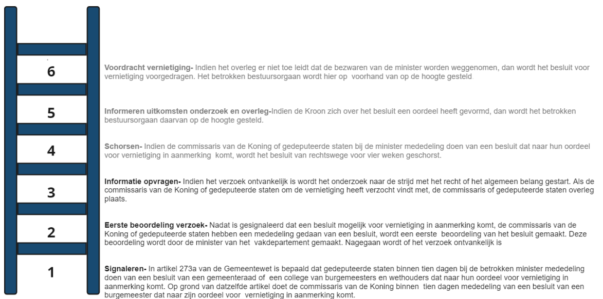
Figuur 2: Interventieladder Schorsing en vernietiging