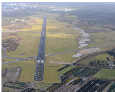
Verharde baan; in de voorgrond de Runway Safety End Area

Wanneer ILenT instemt met de lichtopstelling zal dit ook bekend worden gemaakt door middel van een luchtvaartpublicatie 2) .