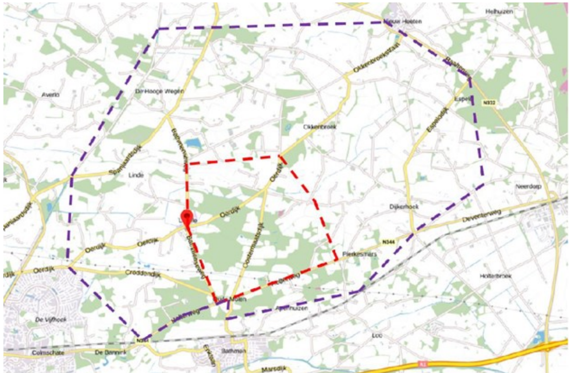
Kaart 1 Landgoed Oostermaat eo : het betreft het gebied binnen de paarse stippellijn.