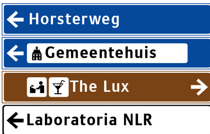
Voorbeelden uitvoering strokenborden

Is het niet mogelijk om de doelen/objecten te groeperen, dan dienen de borden per richting te worden opgesplitst en op een onderlinge afstand van 25 meter van elkaar geplaatst te worden.