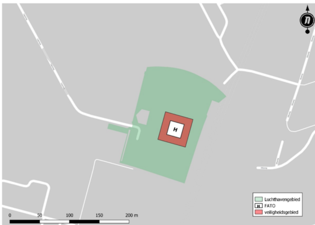
Figuur 2 Luchthavengebied en landingsplaats