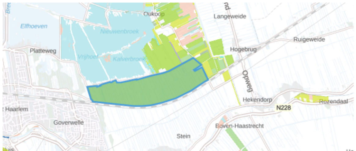
Fig. 5 Polder Stein

Het blauw omlijnde gebied is opengesteld voor inrichting.