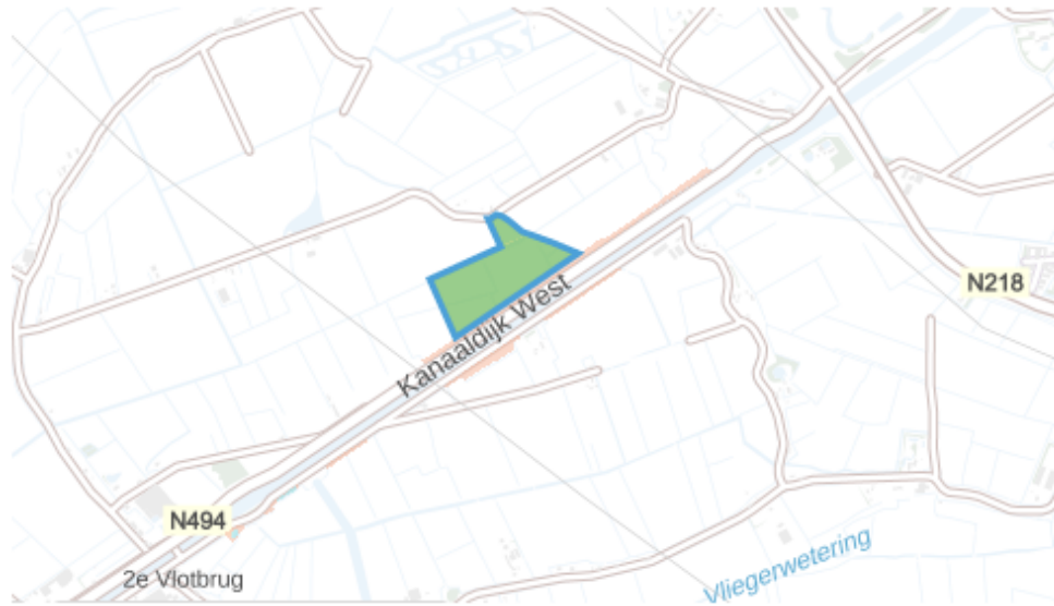
Fig. 2 Hillenhoek Het blauw omlinjde gebied is opengesteld voor inrichting.