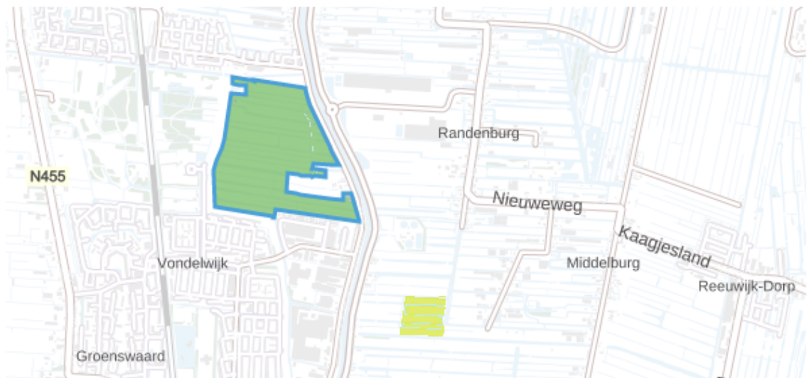
Fig. 1 Voorofsche Polder

Aan bijlage 2 behorende bij artikel 21 en artikel 26 van het Openstellingsbesluit ANLb, SNL en SKNL 2020 worden de volgende figuren toegevoegd: