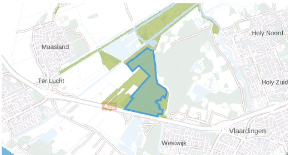
Fig. 7 Aalkeetbuitenpolder

Het blauw omlijnde gebied is opengesteld voor inrichting.