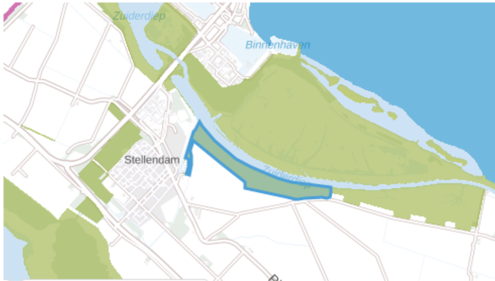
Fig. 6 Zuiderdiepgorzen

Het blauw omlijnde gebied is opengesteld voor inrichting.