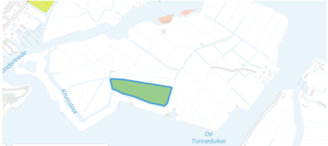
Fig. 4 Zwanburgerpolder

Het blauw omlijnde gebied is opengesteld voor inrichting.