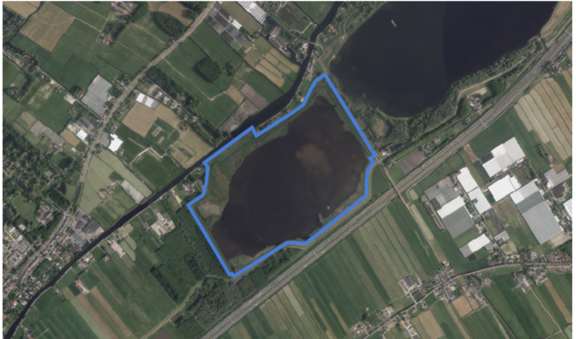
Fig. 8 Vogelplas Starrevaart Het blauw omlijnde gebied is opengesteld voor inrichting.