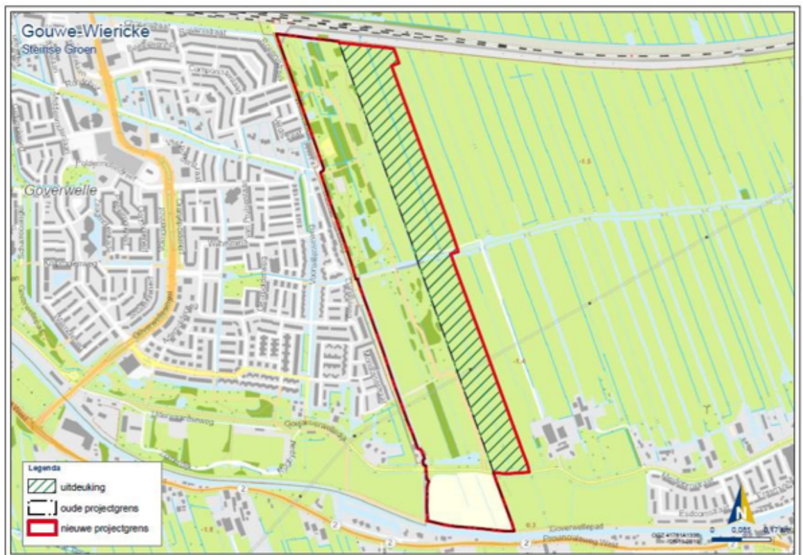
Fig. 9 Steinse Groen Het rood omlijnde gebied is opengesteld voor functieverandering en inrichting.