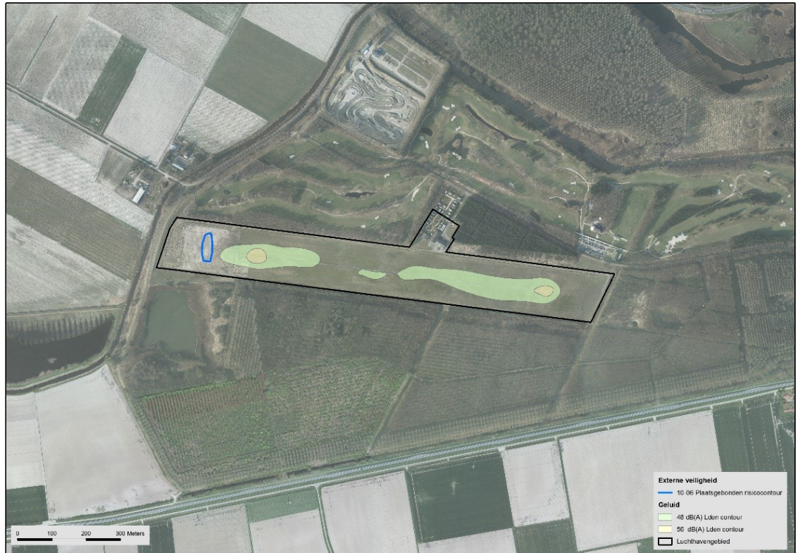
Figuur 1: Ligging van het luchthavengebied, de 48 en 56 Lden geluidscontouren en de plaatsgebonden risicocontour (10-6)

Dit betekent dat er geen verplichting bestaat tot het vaststellen van een luchthavenbesluit maar dat kan worden volstaan met het vaststellen van een luchthavenregeling.