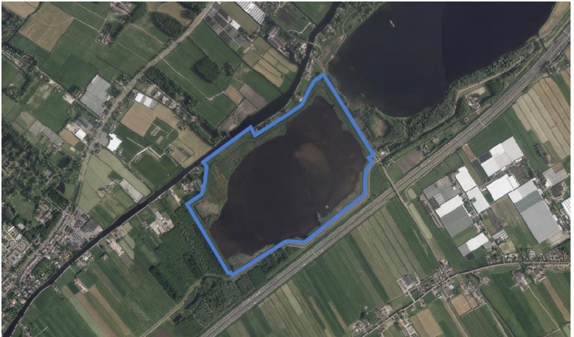
Vogelplas Starrevaart. Het blauw omlinjnde gebied is opengesteld voor inrichting