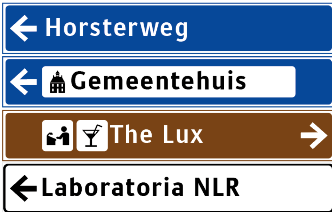
Voorbeelden uitvoering strokenborden

Is het niet mogelijk om de doelen/objecten te groeperen, dan dienen de borden per richting te worden opgesplitst en op een onderlinge afstand van 25 meter van elkaar geplaatst te worden.