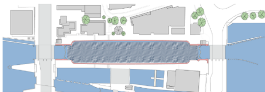
Wilhelminasluis huidige situatie (december 2017)

Op de navolgende figuur is de huidige kolk van de Wilhelminasluis weergegeven. Het gearceerde gebied betreft het gebied waarop dit besluit betrekking heeft.